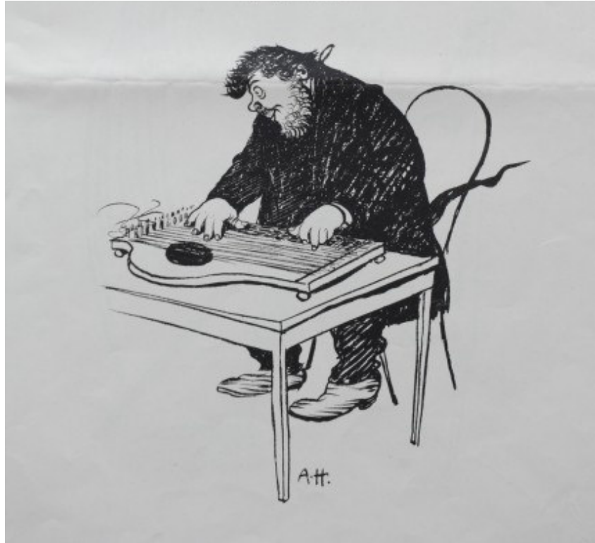
Die Zeichnung zeigt den Maler Gustav Majer und stammt von einem Künstlerkollegen der "Allotria".

Majer ist nur einer von etwa 70 Malern, die im virtuellen Heimatmuseum mit Text und Bildern bedacht sind. Fischer findet es selbst erstaunlich, was dieses Museum alles zu bieten hat: "Das können sie in einem realen Heimatmuseum gar nicht alles zeigen." Dabei war das durchaus mal der Plan. Bürgers Haus birgt eine Sammlung unterschiedlichster Themen aus der Geschichte Schleißheims. Bücher, Ansichtskarten, Bilder, alte Karten stapeln sich hier, sind in Regalen und Kisten verstaubt. Immer wieder gab es Hoffnung, es könnte doch mal ein Museum geben, wo man das alles zeigen könnte, so wie es die Satzung des Vereins auch vorsieht. Zuletzt hatte man laut Fischer den alten Bahnhof ins Auge gefasst. Aber nachdem dieser nicht an die Gemeinde, sondern an einen Investor verkauft worden ist, sind diese Pläne wieder hinfällig.